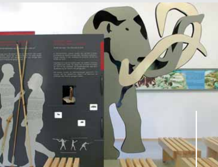
Das HöhlenHaus: Interessante Details zur Erdgeschichte und zu den archäologischen Funden der Lonetal-Höhlen. Nebenbei: Ein „SteinzeitErlebnisplatz“.