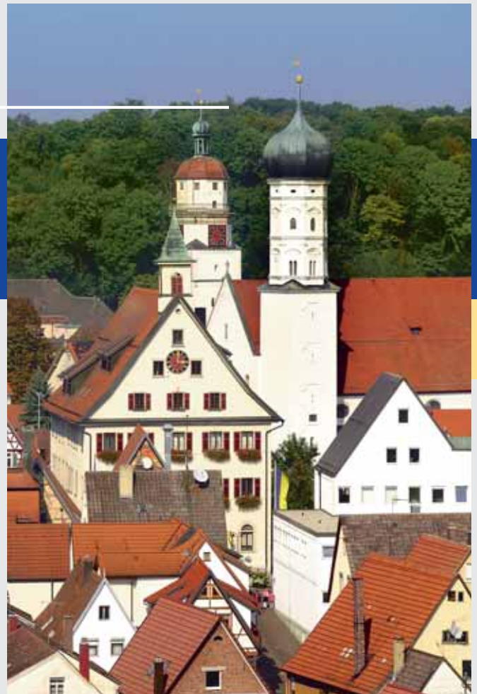
Die Stadtkirche mit ihren zwei unterschiedlichen Türmen.

Im Teilort Burgberg kommen Interessierte und Freunde historischer Mühlen durch einen Besuch in der aufwändig restaurierten Mahlmühle aus dem Jahr 1344 auf ihre Kosten. Ein Abstecher lohnt: Die Geschichte der Stadt Giengen finden Sie im Stadtmuseum im Teilort Hürben.